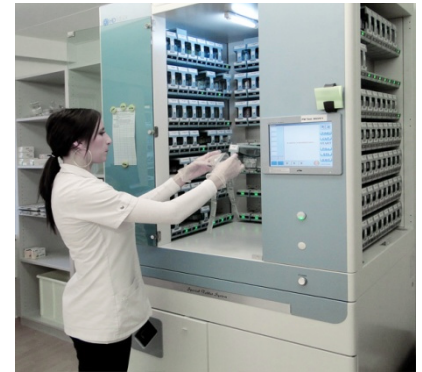
Eine computergesteuerte Maschine packt in der Apotheke die Medikamente nach individueller Dosierung des Arztes in kleine Cellophansäckchen.

wegen komplizierter Verpackungen oder umständlichem Halbieren der Tabletten gerade für ältere Leute oft